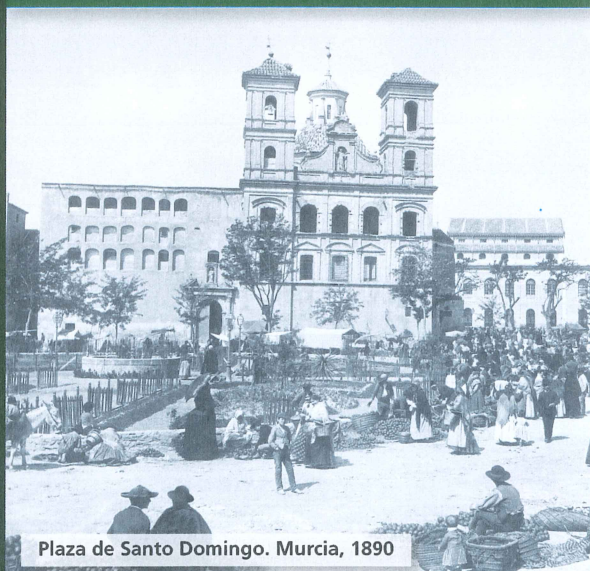
Plaza de Santo Domingo. Murcia, 1890